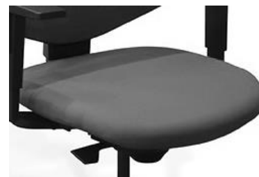
Vora anterior del seient arrodonida

Suport d'injecció en polipropilè amb fibra amb forma ergonòmica, més goma espuma flexible de 45 mm de gruix i densitat de 40 kg/m 3 (PPTEC.11), elaborada sense FCKW o CKW (PPTQC.2), sobre la que es col·loca el teixit que està grapat i cosit sense cap tipus de cola (PPTQC.1).