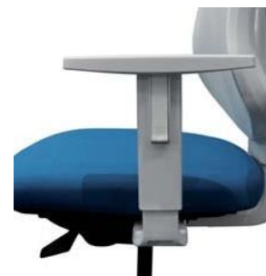
Detall del braç Ofertat en color negre